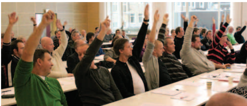
Ivriga röstande händer räknas från podiet i ett av flera beslut som skedde efter handuppräknning.

Nästa nummer av Byggvästen, nr 2 2012, kommer i april 2012. Har du tips eller idéer om t ex arbetsplatser att besöka ring 031-774 33 61 eller maila marie.thegerstrom@byggnads.se