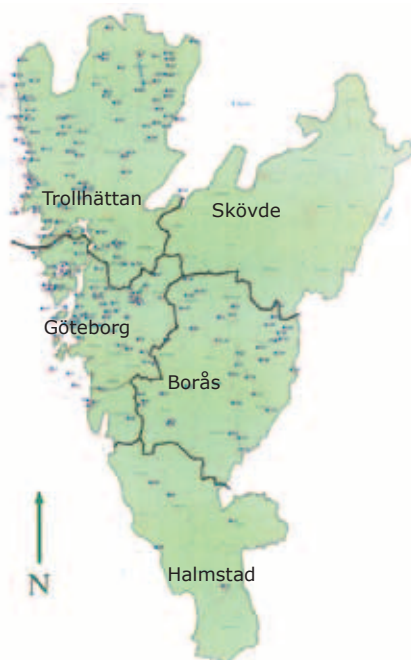
Karta där de olika verksamhetsområdena är markerade. Karta från Västkostiftelsen.

- Alla får bjuda till. Detta är fackförningens hörnsten. Om för få kommer på mötena har vi ett stort demokratiskt problem.