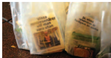
Den tydliga uppmaningen är att arbetskläderna ska lämnas på jobbet.