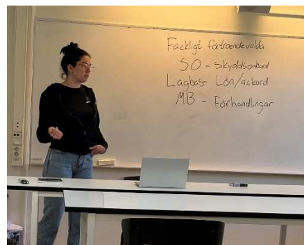
Moa kör skolinformation

Den regionala ungdomskommittén har snart genomfört de sista skolinformationerna.