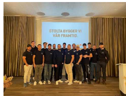
Regionala ungdomsutbildningen 2022

Är du under 30 år och har arbetskamrater i samma ålder? Tveka inte att anmäla er till utbildningen i vår!