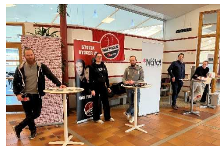
Gymnasiemässa på Anders Ljungstedts gymnasium i Linköping tillsammans med *Näta Öst, HRF, Livs, IF Metall, Elektrikerna, Kommunal och Handels.

Är du nyfiken och vill hänga med ett härligt gäng likasinnade ungdomar?