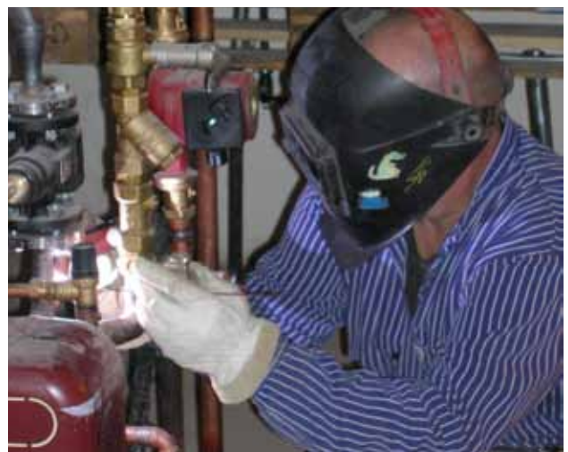
Vid TIG-svetsning bildas vanligen lite svetsrök.