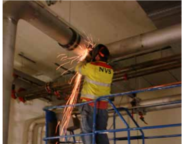
Slipning i samband med pinnsvetsning.