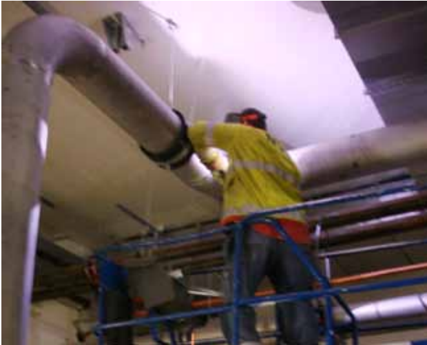
Svetsning från saxlift.