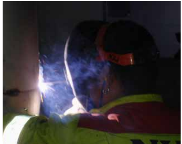
Pinnsvetsning. Det uppstår kraftig rökutveckling vid svetsning med belagda elektroder.