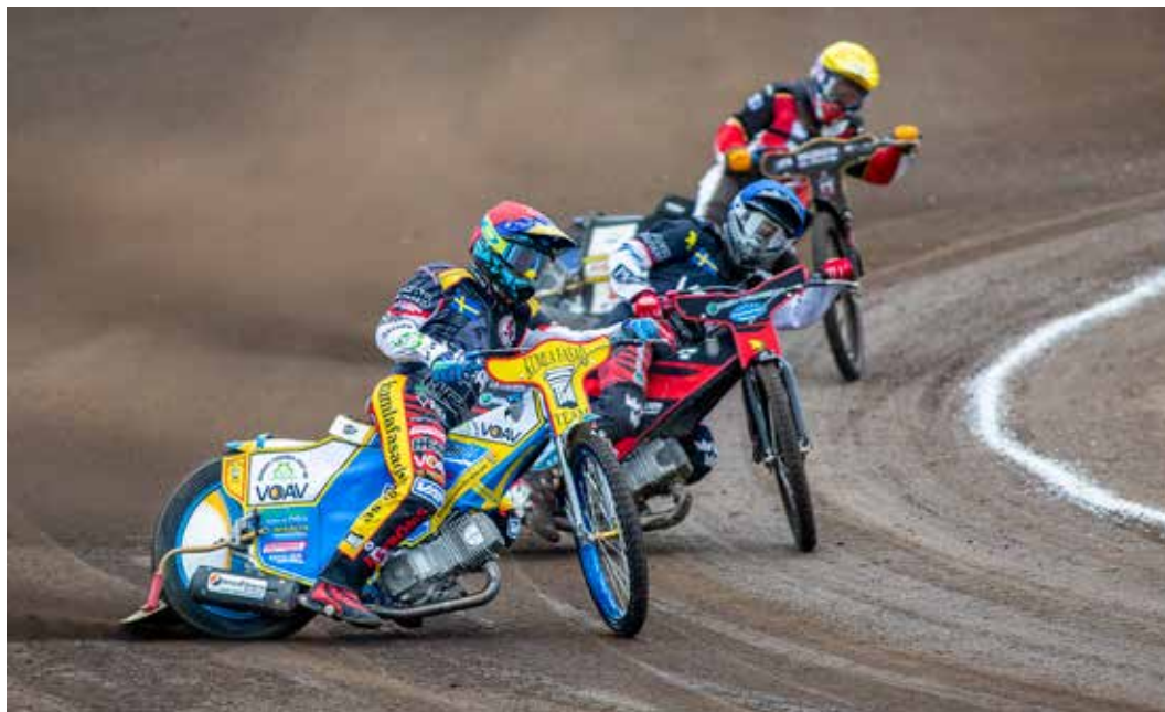
Denna sommarkväll mötte hemmalaget Indianerna gästande Smederna från Eskilstuna. Ett rafflande möte som bjöd på spänning in i det sista.