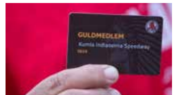
Guldmedlem: Nu och för all överskådlig framtid. Kärleken till speedway hänger med genom livet.