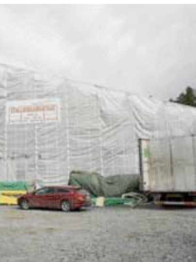
plasttält för att hålla fukten hustekniken.