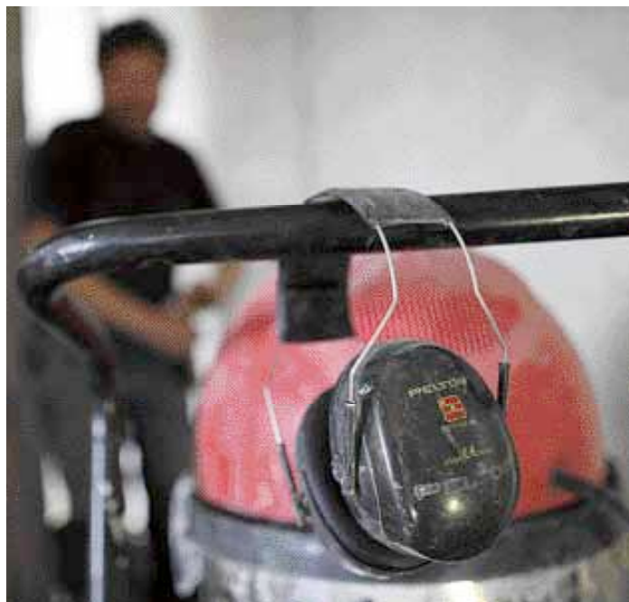
Lärlingslöner och arbetstidsförkortning blev stridsfrågor när Byggnads gick ut i konflikt för VVS- och plåtavtalen.

Det var Byggnads som nobbade budet från medlarna. Enligt Torbjörn Jo-