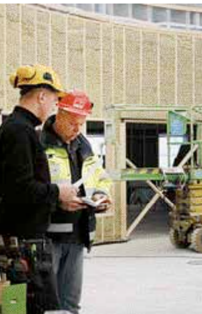
Byggnads, passar på att prata Skough.