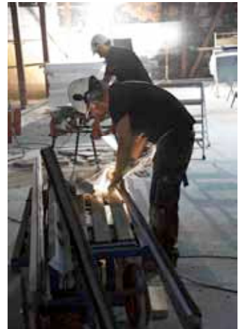
Byggavtalet är klart och grundlönen hamnar på 136:50.