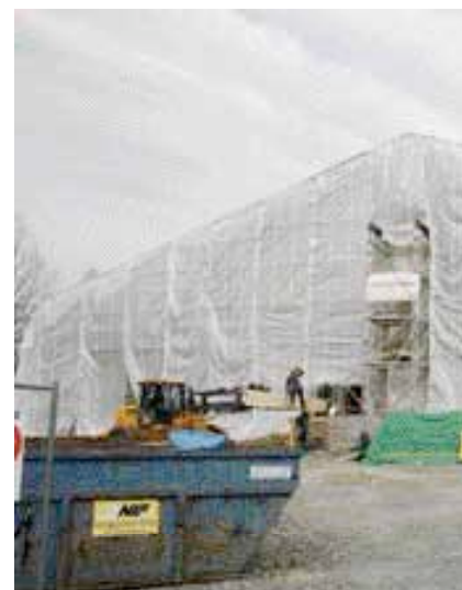
Hela bygget äger rum under ett borta från den noggranna passiv-