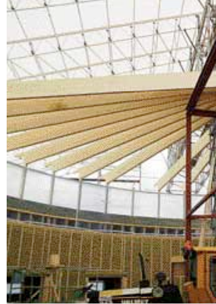
Takstolar av limträbalk formar