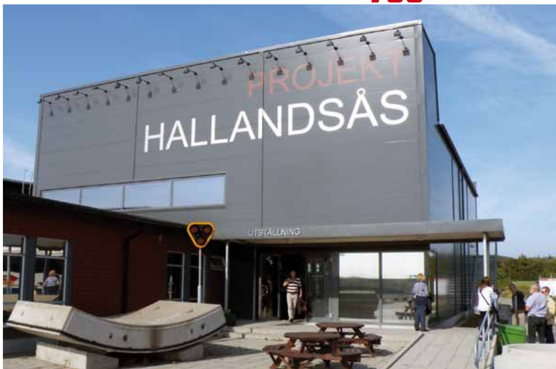
På bilden syns ett av de 41.000 betongsegment, som betongröret i tunneln består av. Varje segment är 2,2 m brett och väger 12 ton. På Skanska -Vincis fabrik i Åstorp tillverkas 32 st/dag

En septembereftermiddag åkte avdelningens anställda på studiebesök vid det beryktade tunnelbygget under Hallandsåsen. Tunneln ingår i utbyggnaden av Västkustbanan och här kommer att kunna passera 24 tåg/tim istället för dagens 4. En viktig miljövinst, då mer gods kan fraktas på järnväg, istället för lastbilstrafik.