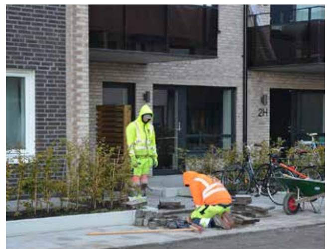
Sista plattorna framför redan uthyrda lägenheter.

Projektet är en del av ett större utbyggnadsområde, Råbylund II, söder om Dalbyvägen i östra Lund. Bostadsområdet ansluter till ett nytt lokalt gatunät och åt väster ligger ett större grönområde med sjö. Totalt innefattar projektet 180 st lägenheter och tre mindre lokaler i tio huskroppar. Totala bruttoarean är cirka 15 900 kvm. Husen har varierad höjd, från två till fem våningar. Alla lägenheter har egen tvättutrustning, det finns inga gemensamma tvättstugor. Husen är grundlagda på isolerade betongplattor på mark. Bjälklagen är platsgjutna med ingjutna installationer. Takstolarna är uppstolpade och taken isolerade under takytan. Taken är utformade med olika vinklar och är belagda med både papp och bandtäckt aluminiumplåt. Ytterväggarna är både utfackningsväggar (med och utan bärande stålpelare) och som bärande delar i betongskiva. Alla väggar har tegelfasad. Slutbesiktningarna är spridda över hela 2017, överlämning sker 30 november 2017