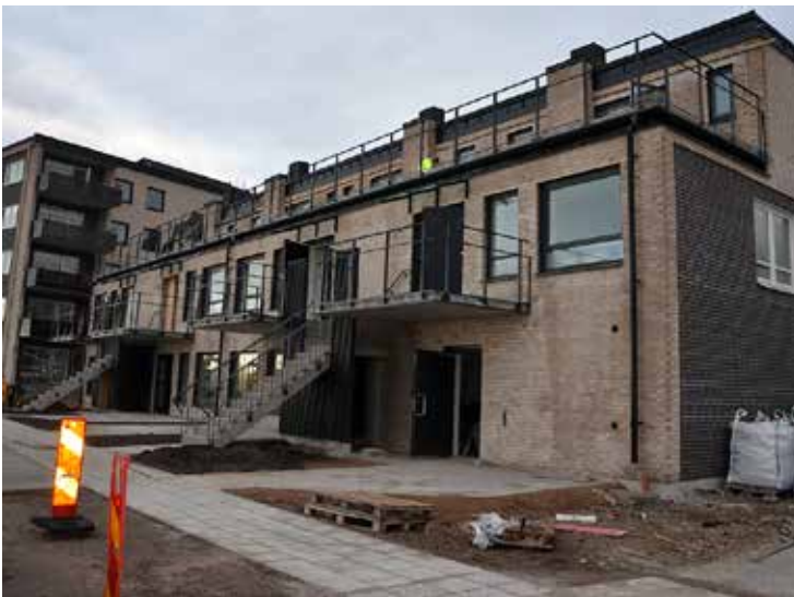
Sista etappen med etagelägenheter med sjöutsikt är snart inflyttningsklara.