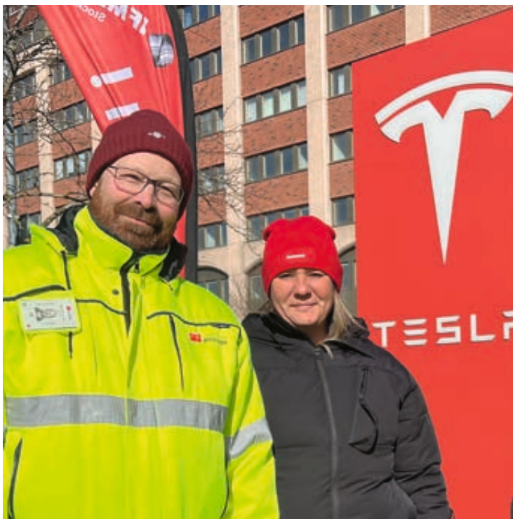
Byggnads och Kommunal på plats för att stötta strejkvakterna.