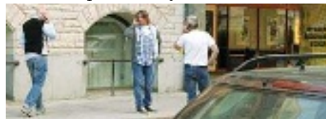
Fredag kl 20. Hemkontakten fick skötas i en paus i överläggningarna som höll på till 00.35