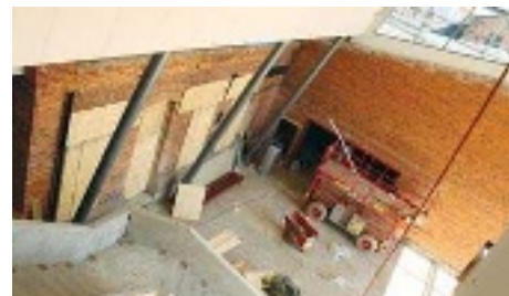
Inte många räta vinklar i entrén eller i övrigt.

Gipsplattorna träser ner under golvet för ljudets skull.