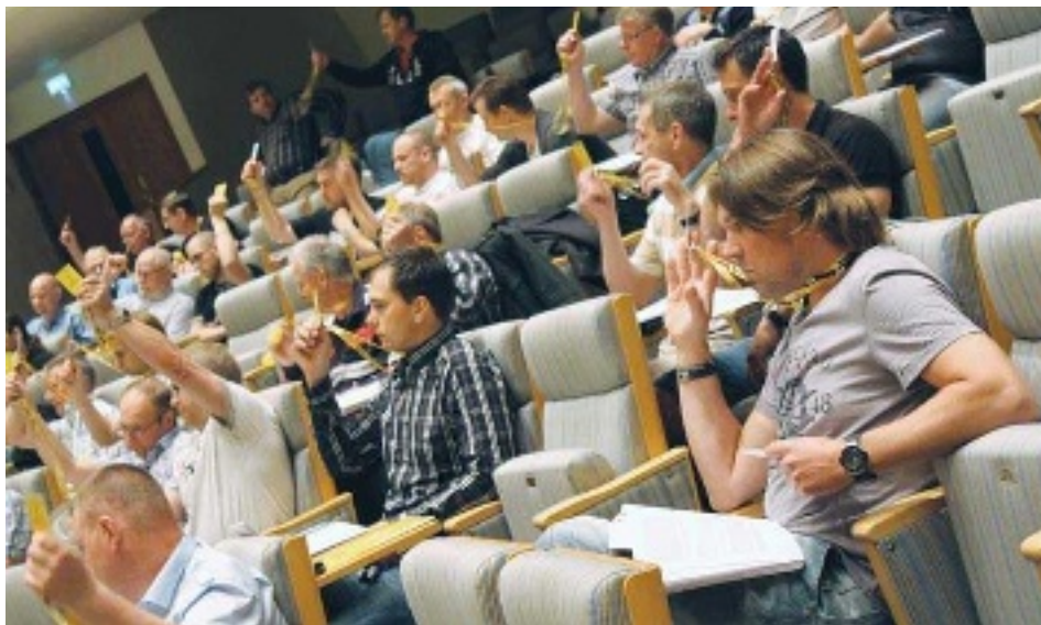
Det gäller att hänga med i svängarna när motioner behandlas. Här sker votering med röstkort.