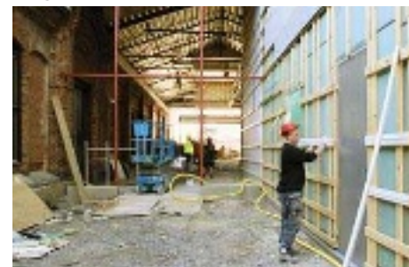
Gammal och ny bebyggelse blandas.