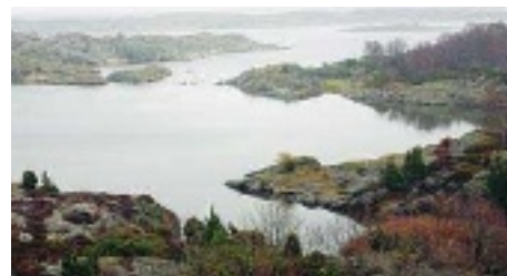
Oktoberspegel. I närheten av stugorna på Gullholmsbaden är höstnaturen svindlande skön.