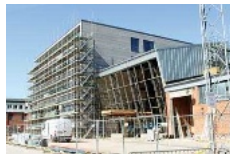
Nu går det att se hur Kulturhuset ska se ut.