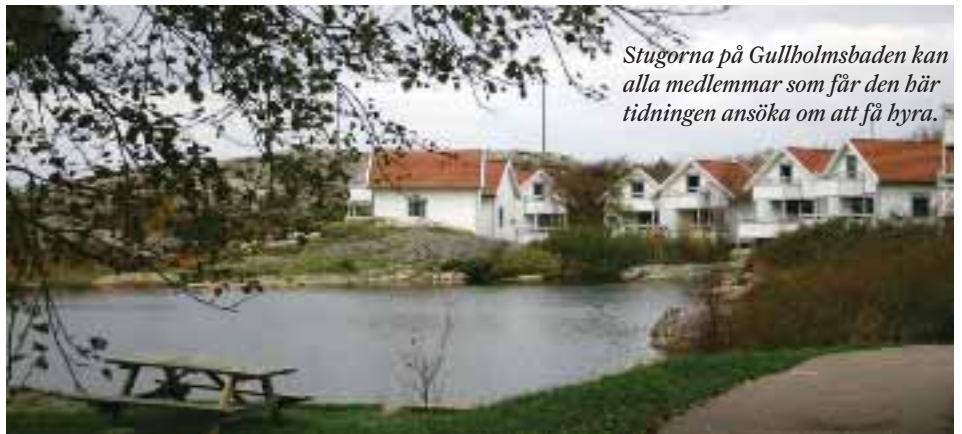
Stugorna på Gullholmsbaden kan alla medlemmar som får den här tidningen ansöka om att få hyra.

Skriv senast 28 febr till: Trisslottävlingen, Byggvästen, Olof Palmes Plats 1, 413 04 GÖTEBORG alt marie.thegerstrom@byggvads.se (glöm ej personuppgifter)