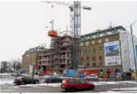
Från Åkareplatsen ser man hur den nya hotell-delen börjar resa sig över taket på posthuset