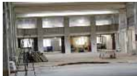
Ytorna är enorma. Där det nu står utrivna radiatorer har man provat att spela badminton. Pelarna är K-märkta. För de ska vara K-var.