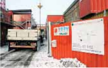
Logistiken och trafiken är en utmaning. Här ska leveranserna komma på minuten.