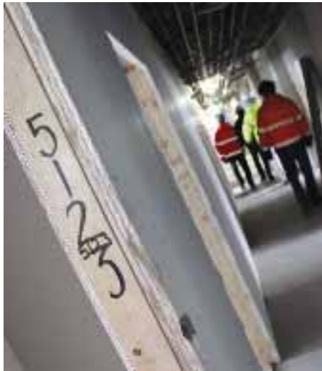
I långa vindlande korridorer i den gamla byggnaden inreds 325 rum.

När allt står klart ska vi alla kunna gå rakt igenom huset mellan Åkareplatsen och Drottningtorget och vi ska kunna ta en fika på den bevarade uteterrassen. Skriver in sig gör man då i en hotellreception.