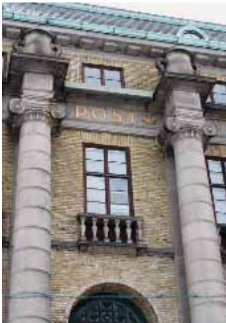
Fasaden och taket är några av de delar på byggnaden som är byggnadsminnesmärkta.