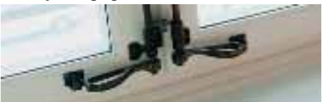
Även fönstren ska ha ursprungligt utseende. Men de repareras och renoveras.