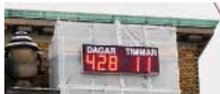
Klockan räknar ner mot öppningsdagen av Hotell Clarion Post i slutet på januari 2012.