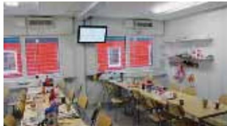
Alla bodar är nya och utförda i den nya standard som är obligatorisk om några år. På tv-skärmen lämnas information om bygget.