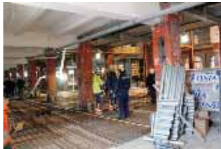
Här ska entrén stå klar om ungefär ett år. Golvet är höjt ca 70 cm.