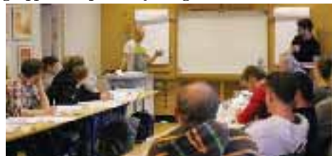
Här får fackliga förtroendemän och MB-ledamöter reda på hur arbetarrörelsen vuxit fram.