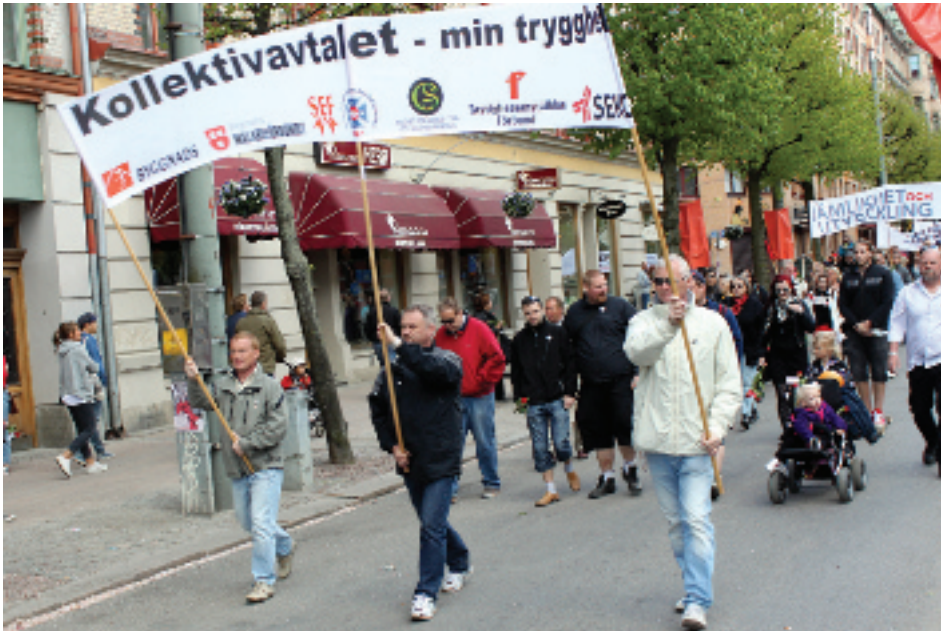
I Första maj-tåget ges tillfälle att synliggöra vad du anser vara viktigt i arbetsliv och samhälle.

För övriga orter, leta information i tidningar, övrig media och på hemsidor för att få reda på avgångstider, talare, klockslag och platser dit du kan gå.