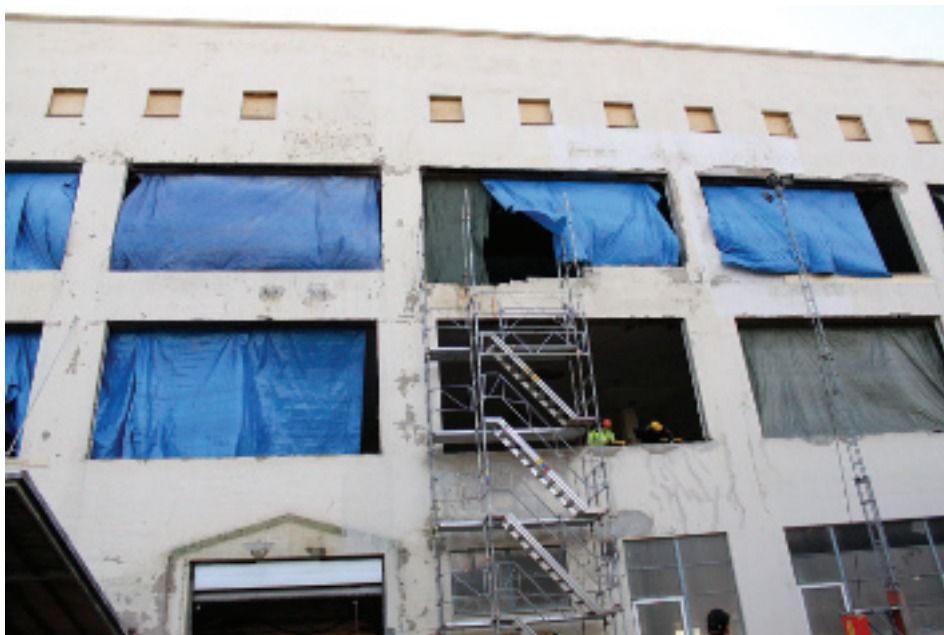
Simonslands spökfasad byter skepnad så sakteliga. Ödehusen förvandlas till textilt centrum.