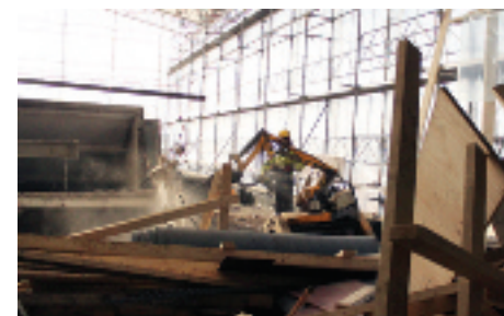
Damm och öronbedövande buller är vardag.