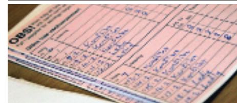
Konfliktkort fylldes i för att få ersättning.

Läs även om Glas- och Entreprenadmaskinavtalsförhandlingarna på hemsidan.