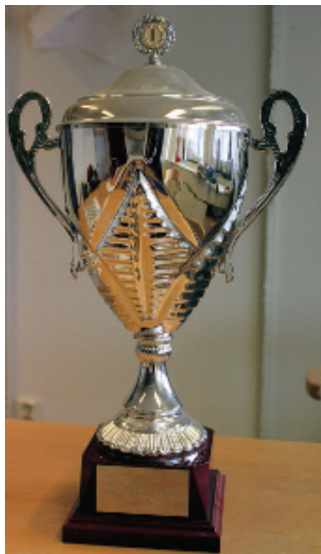
Värd att kämpa för!? Boråslaget vann 2010