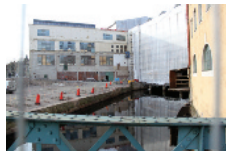
Här byggs nytt, efter sanering, intill Viskan.