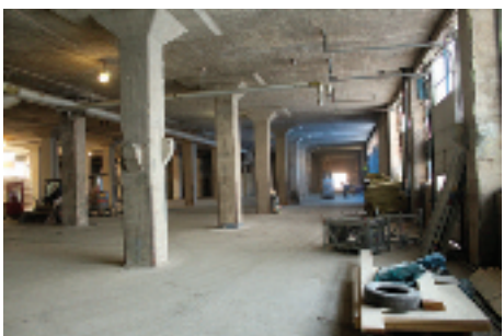
Det är enorma ytor som har röjts ut. Dammet är ständigt närvarande. Vid en rundvandring i byggnaderna är det svårt att förstå att över 100 personer finns på arbetsplatsen.