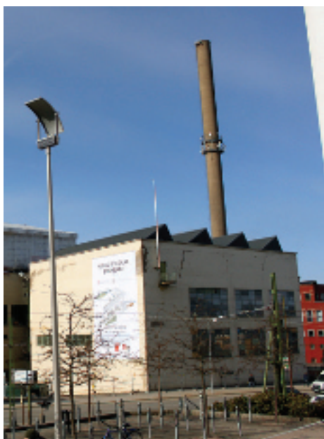
Det karakteristiska sågtandstaket bevaras och har blivit omvandlat till en grafisk symbol för hela bygget. Tidigare fanns två skorstenar men en gick inte att bevara.