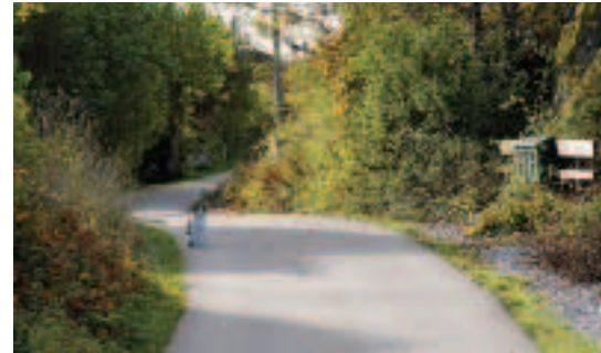
Det är lätt att hitta och det finns bra vägvisare. En del av den av barnbarnen kallade Paradisstranden. Ibland ser man inte en katt på vägarna. Eller...