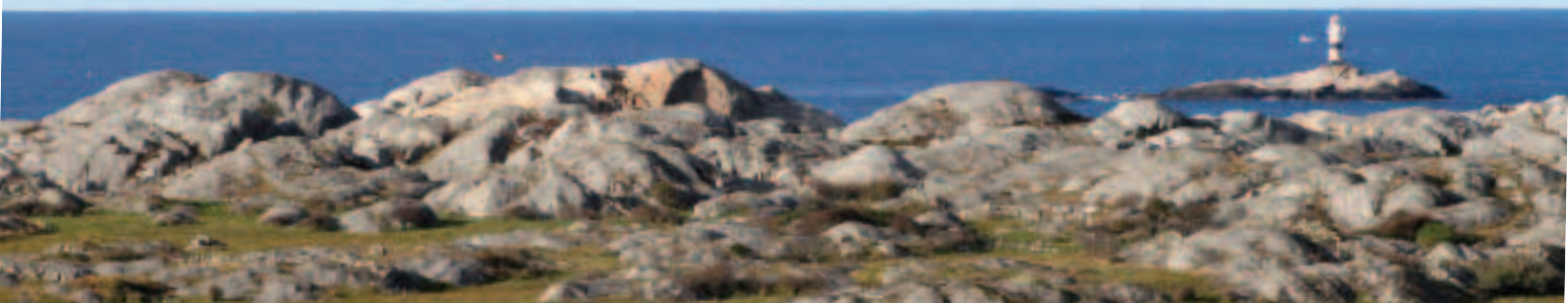
Efter en stunds vandring till klipporna, på utmärkta leder, väntar en obruten horisont att vila blicken i. Och många vikar för bad och lek.