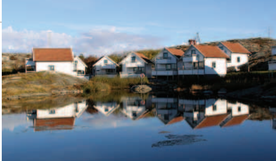
Två av Byggnads tre stugor, nr 5 och nr 7, ligger alldeles intill ljungklädda berg.