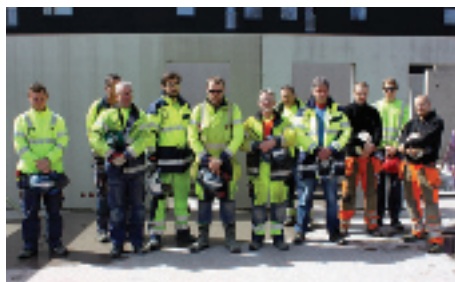
På Skanskas arbetsplats Soldathemmet i Kviberg avstannade arbetet under en minut för att hedra byggnadsarbetare som avlidit på arbetet.

Flera byggnadsarbetare dör varje år på jobbet och minst 1 400 människor per år avlider av arbetsrelaterade olyckor. Nästan varannan byggnadsarbetare klarar på grund av dålig arbetsmiljö inte av att jobba till 65 år. Det borde vara självklart att börja med att förbättra arbetsmiljön innan exempelvis höjd pensionsålder kommer att införas.