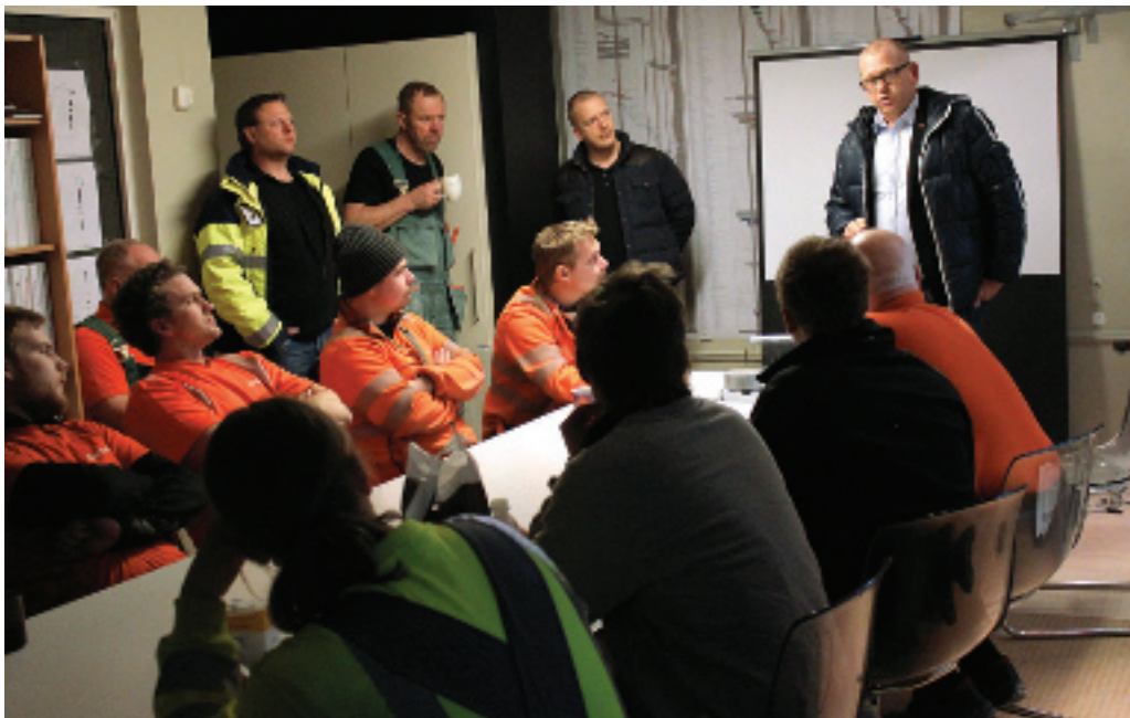
...information om det nya avtalet kl 6.30 på sextonde våningen i Gothia Towers i Göteborg. Därefter taxi till flyget och förhandlingar kl 10 i Stockholm om lönenivåerna i Byggaavtalet.

Övertids- och OB-ersättning på utgående lön