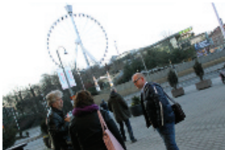
Det snurrar på för en förbundsordförande. Efter intervju med Aftonbladet kl 6 väntar...