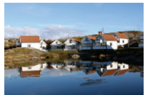
En obruten havshorisontlinje väntar om man kliver upp på berget bakom Gullholmenstugorna