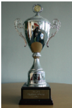
Förra årets förvärvade tredjeplats-buckla.