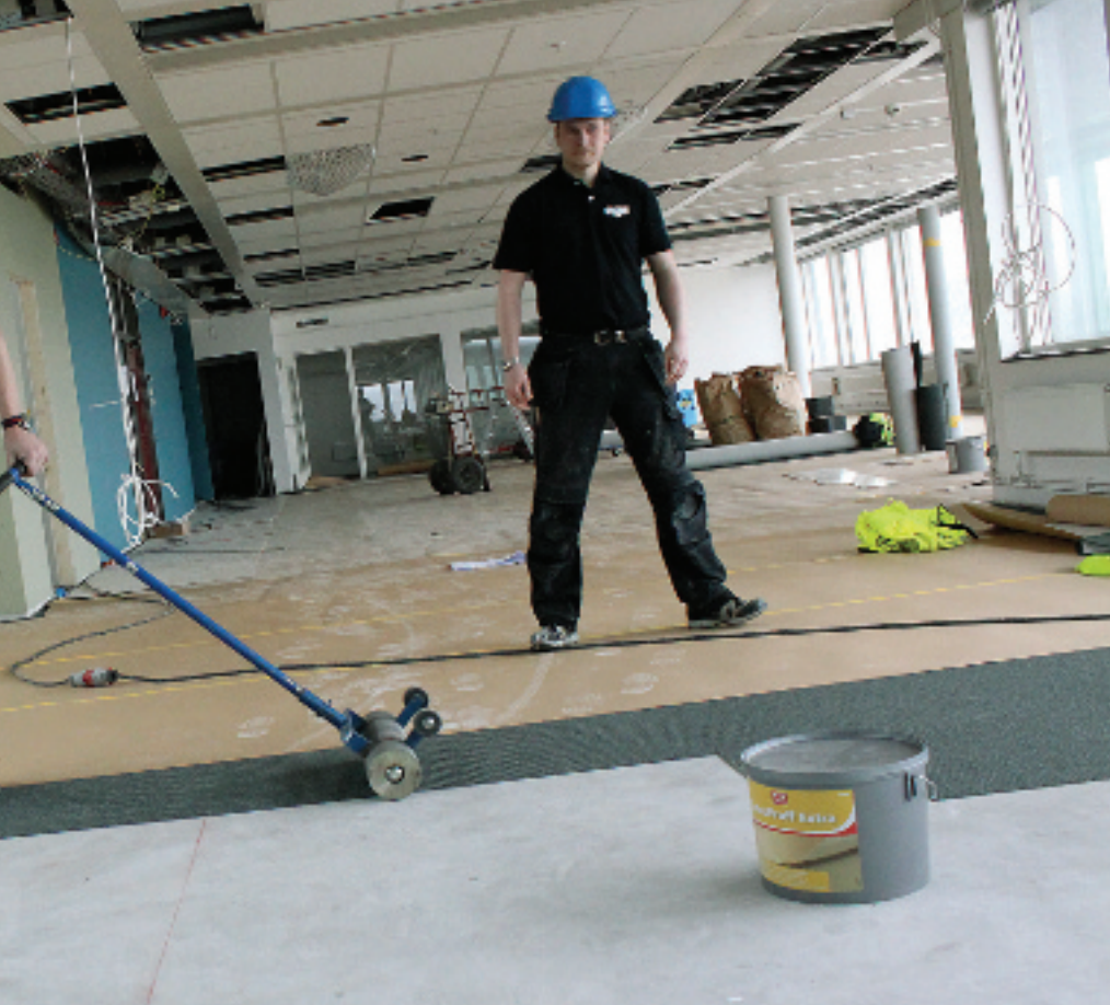
sig. Men de stressar inte heller. Stora ytor, som här på Skanskas före detta kontor, trivs de med.

vänds vattenbaserade lim och dubbelhäftande tejp. Och de har raster, utan jobbprat. De lämnar då ofta bygget.