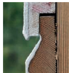
Liggande fasadbrädor kan ställa till problem. Här ska en dropplist göra nytta.

att återta arbetet med visningshuset idag. För det skulle visas upp som förebild i en stundtals orolig bransch.