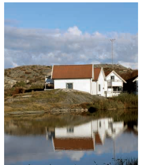
Det är aldrig långt till havet på en ö. Gullholmsbadens stugor ligger dessutom vid en liten sjö.