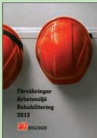
Alla medlemmar har fått denna.

Ger minst 12,5 % av betald sjukpenning i ersättning vid sjukskrivning från dag 15 om man varit anställd minst 90 dagar i företag med avtal. afa.se .