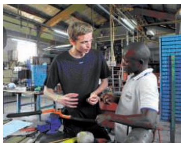
Nyfikenheten från besökarna inspirerade både lärare och elever.

Ivintras, efter månader av förberedelser, åkte sexton elever och fyra lärare från VVS-programmet på Kattegattgymnasiet i Halmstad till Moshi, en stad vid Kilimanjaros fot. De skulle, via ett samarbetsprojekt för yrkes elever i Universitets- och Högskolerådets regi, byta erfarenheter med VVS-elever och lärare där. Elever från olika länder skulle mötas och dela erfarenheter. Modern teknik i Sverige mötte mer grundläggande i Tanzania. Teoretiska och praktiska lektioner genomfördes, på engelska. Här arbetade alla tillsammans med t ex lödning och rördragning. Skolan är en internatskola och