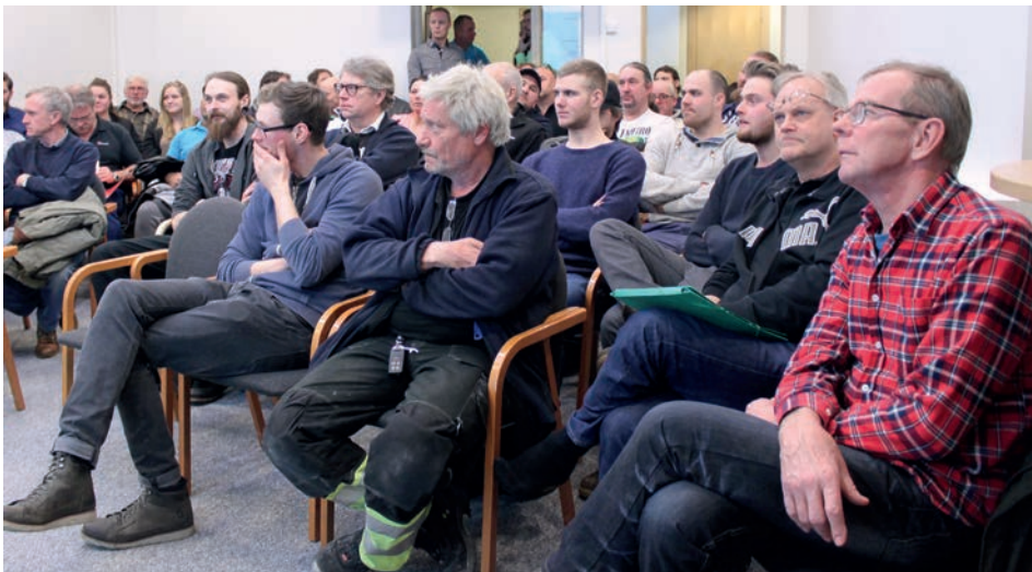
Krets Göteborgs första möte. Medlemmar från Göteborgs verksamhetsområde samlades på Byggnads Väst kontor den 4 februari för ett första möte i den nya kretsen.