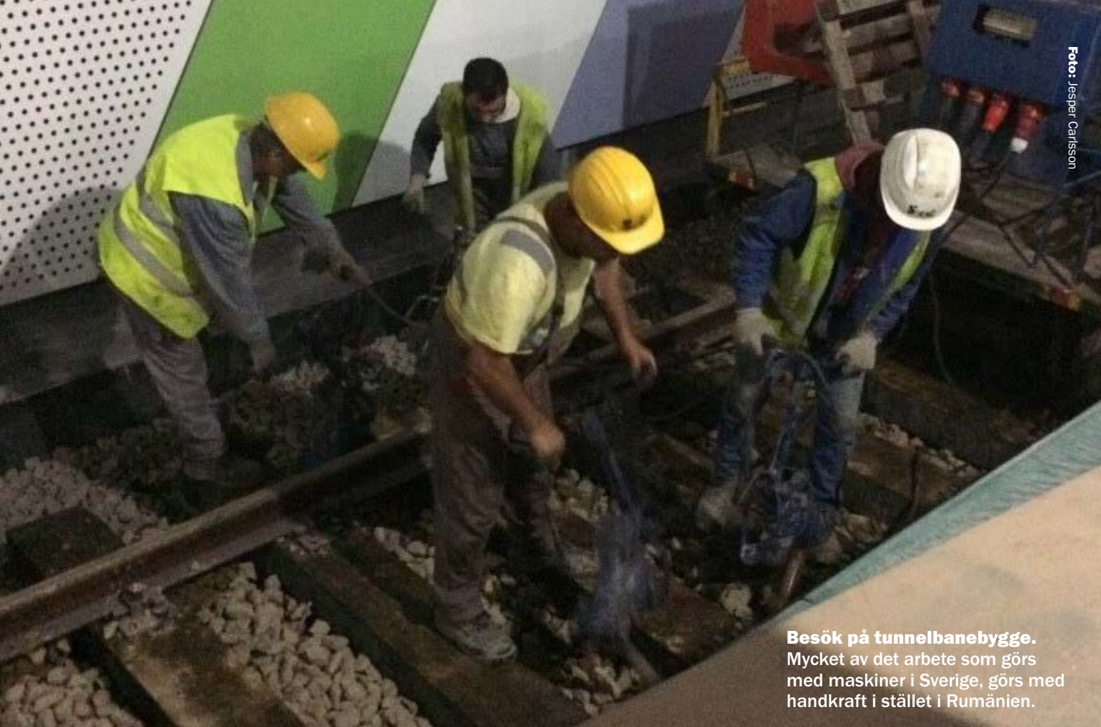
Besök på tunnelbanebygge. Mycket av det arbete som görs med maskiner i Sverige, görs med handkraft i stället i Rumänien.