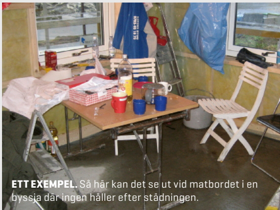
ETT EXEMPEL. Så här kan det se ut vid matbordet i en byssja där ingen håller efter städningen.

Meddela Byggnads Väst om ni ser arbetsplatser där de inte sköter städningen.