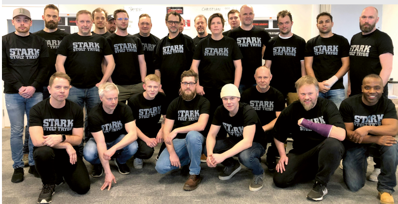
PÅFARTEN. Göteborg i vintras.