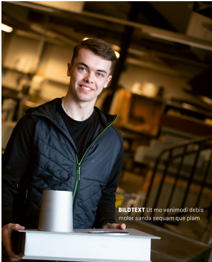
BILDTEXT Ut mo venimodi debis molor sanda sequam que plam

Han är tävlingsinriktad och läste byggnadsplåt med en kombination av NIU (nationell Idrottsutbildning) på Svene-