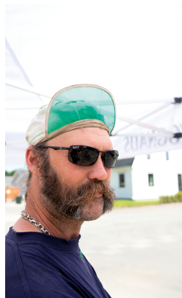
SMED. Martin har jobbat som byggnadssmed i 25 år, ändå stöter han fortfarande på nya utmaningar.

– Jag har även suttit med i kretsstyrelsen ett tag. ■