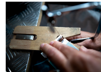
NYTT PROJEKT. Detta ska bli en hästsko.

– Jag hoppas vi kan hitta ett par frågor att driva hårdare och göra skillnad så att vi inte bara blir ett gäng som sitter och fikar och har möten. Vi kan också dela med oss av kunskap till de yngre.