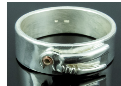
POPULÄR. Rörtången var ett självklart val och den vill många ha.