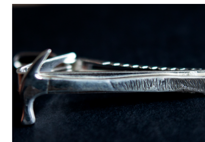
HAMMARE. Smyckena finns i olika former, här som slipsnål.